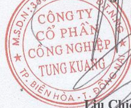
Lưu Chiến Hưng